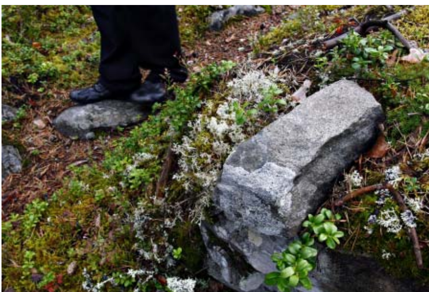
Vaiivhainen maamerkki on ollut todennäköisesti suuntaviitta korsulle.

JANTSO JOKELIN, TEKSTI KARI MANKONEN, KUVAT